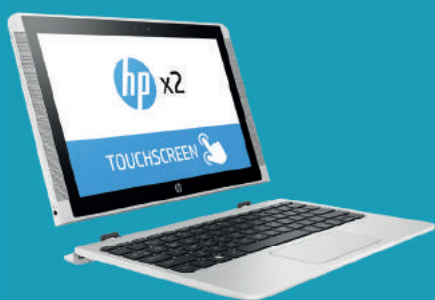
Tablette HP X2