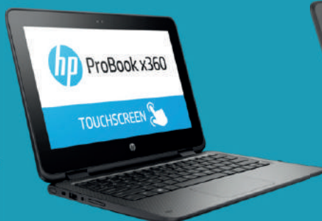
Ordinateur HP X360