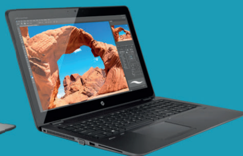
Ordinateur HP Zbook